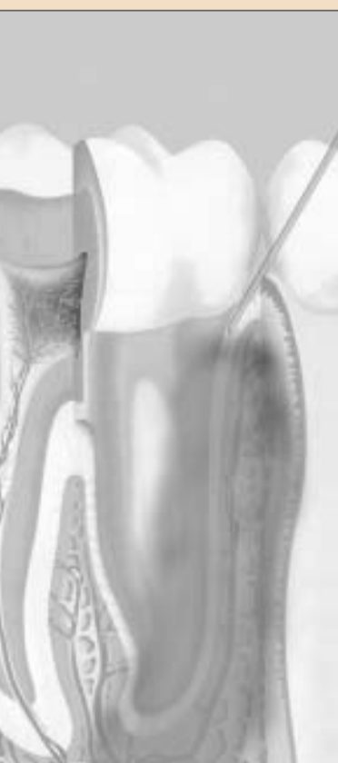
Intraligamentäre Injektionen erfolgen via Sulcus gingivalis ins Desmodont des zu behandelnden Zahnes – in einem Anstellwinkel von ca. 30°.

Die Thematik der intraligamentären Anästhesie wurde in den letzten 5 Jahren in einer Vielzahl von Publikationen ausführlich beschrieben. Der medizinische Fortschritt und die neuen wissenschaft-