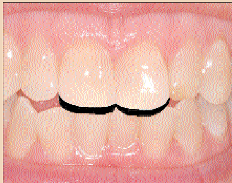
Was ist denn hier los? Die Auflösung finden Sie bei der Erläuterung zu Tipp 9.

Tipp: Das Matrizenband nicht horizontal einfügen, denn damit zieht man das Band zusammen und kann keine ausge-